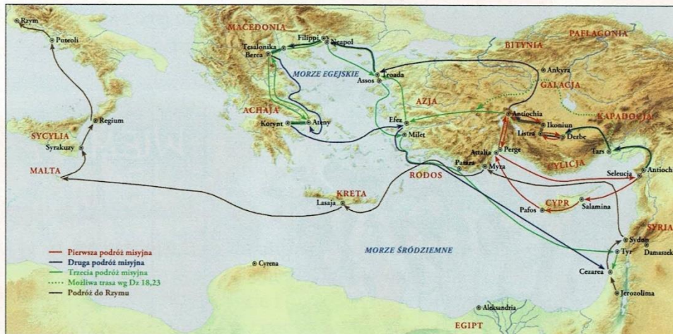
Mapa podróży misyjnych św. Pawła

Areopag, gdzie św. Paweł wygłosił swoją mowę, przeszedł do historii jako miejsce spotkania wielu kultur i religii. Ateńczycy gromadzili się na nim, aby posłuchać różnych nowin. Było to również miejsce posiedzeń przedstawiceli rady miejskiej. Choć można odnieść wrażenie, że Paweł poniósł klęskę w rozmowie z filozofami, to jednak spotkanie to było bardzo ważne. Było to pierwsze wystąpienie św. Pawła w miejscu publicznym, skierowane do szerokiego kręgu słuchaczy.