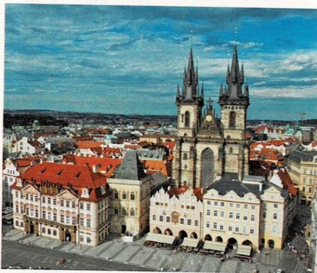
Kościół NMP przed Tynem w Pradze, od XI w., Czechy