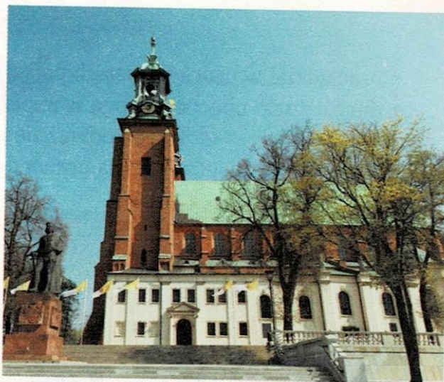
Bazylika archikatedralna Wniebowzięcia NMP, Gniezno, IX w., Polska