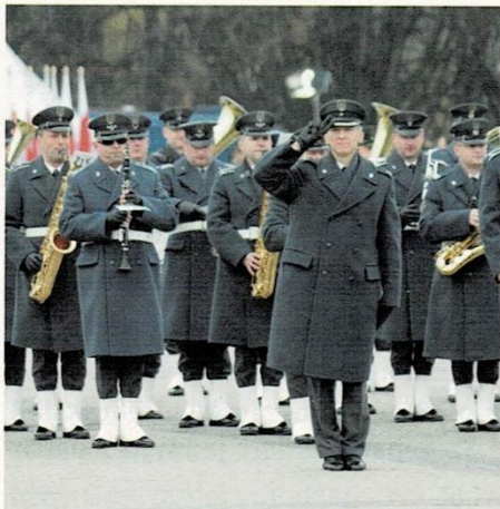
Parada wojskowa podczas obchodów Święta Niepodległości w Warszawie